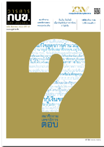
คลิกที่ภาพ เพื่ออ่าน